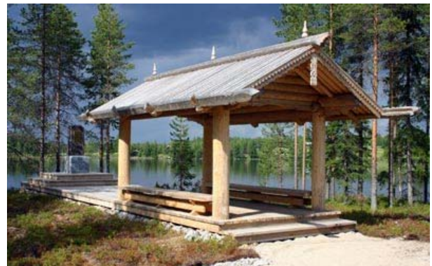
Komea muistomerkki kauniilla paikalla Kuivajärven rannassa!