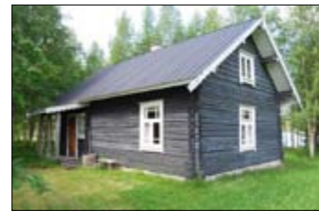
Savusauna – parempaa saunaa ei löydy. On- neksi pääsin kokeilemaan sitä kunnolla!