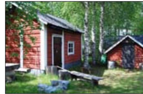
Mummon mökissä ei asu sammakoita. Sekin ainoa, jonka näin hyppävän eteeni sänkyyn, oli vain unta.

Vierailimme myös Domnan pirtissä, ja vaari olisi halunnut näyttää minulle valo- kuvanäyttelyn sen yläkerrassa, mutta se oli ilmeisesti jo lopetettu, koska yhtäkään valokuvaa emme löytäneet.