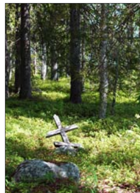
Kalmosaari on kaunis, rauhallinen ja tunnel- mallinen hautausmaa.