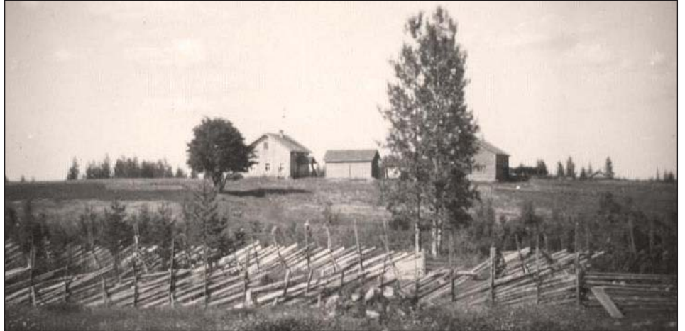
Viettola 1950 Kiimavaaran suunnasta kuvattuna.

Ulkoilimme kiertelemällä ja katselamalla tuttuja tantereita sekä lapsuutemme leikkipaikkoja. Kävimme Lapinniemiessä haudoilla suunnitellen samalla, mitä hautausmaan aidalle olisi syytä tehdä. Muisti-