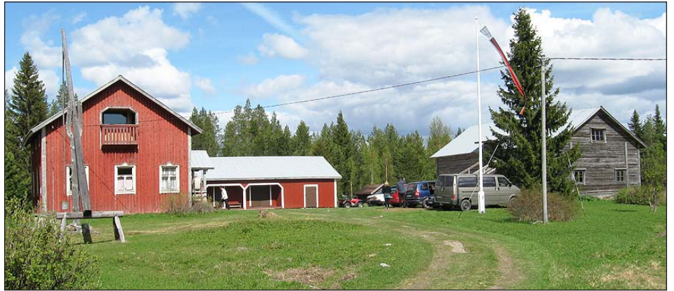
Viettolan tilan viehättävä pihapiiri kesällä 2012.