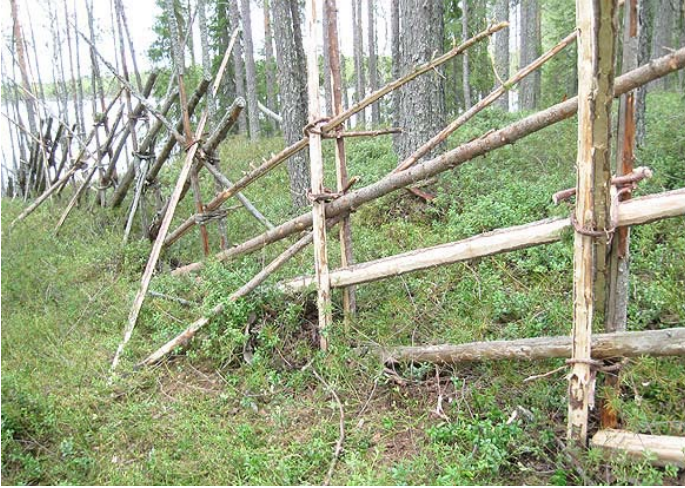
Jotain uutta, jotain vanhaa – perinneaita kestää.

sinne kertyy matkaa 60 kilometriä suuntaansa. Rimmin kylän vahva ortodoksinen hengellisyys on vuosikymmenien saatossa ja väen vähetessä häipynyt miltei kokonaan pois, mutta hautausmaa kertoo alueen historiasta ja asukkaista paljon.