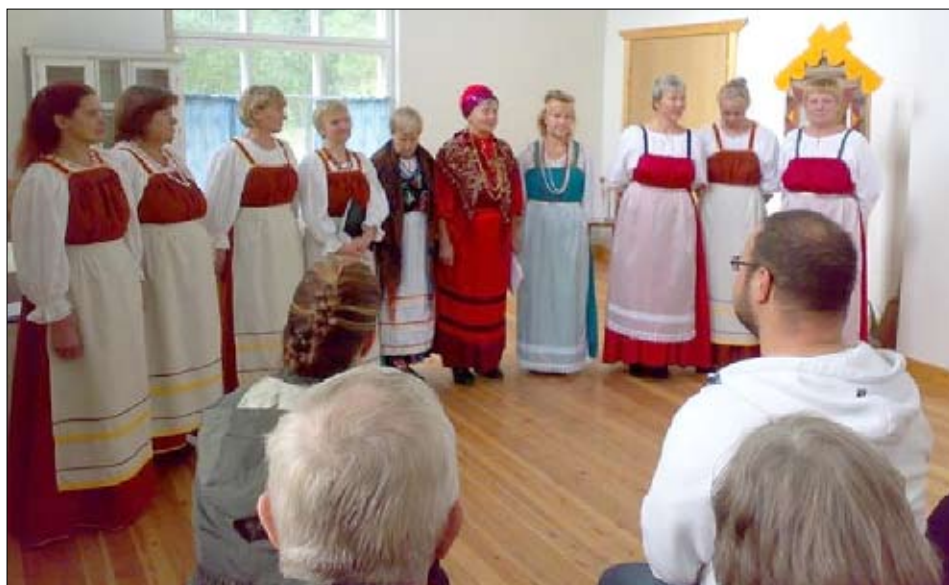
Vuokkiniemen Martat kylätalolla.